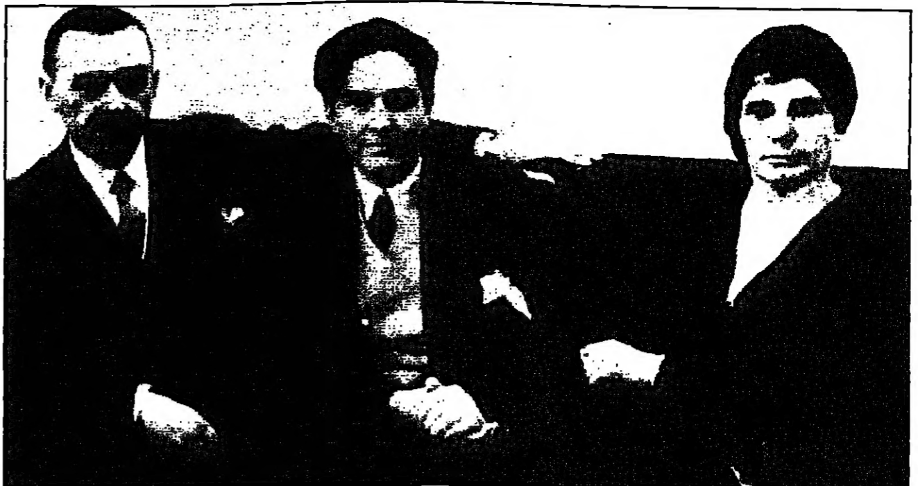
توماس مان في لقطة عائلية